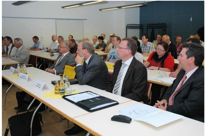
Teilnehmer der Regionaltagung