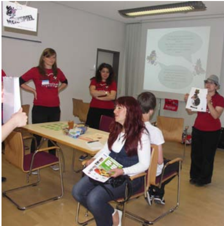
Foto: Nieme Gedächtnistest des Instituts für Physiologie

Wer sich nach all diesen Eindrücken und Erfahrungen etwas ausruhen wollte und dabei Live Musik hören, war im Innenhof des ZENIT richtig, hier spielten die Uni Band „Anatomics“, die sich aus Studenten und Professoren der Medizinischen Fakultät zusammensetzt, und die Band „Dezernat6“ bis in den frühen Morgen. Gespielt wurden Stücke aus den Sechzigern bis in die Gegenwart, von Rock bis Pop. Für kühle Getränke und ein warmes und kaltes Speisenangebot hatte das MUKS Forschungs-Bistro gesorgt.