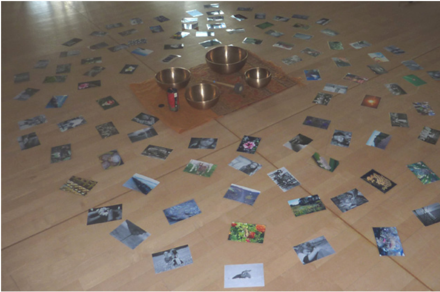
Eindruck aus der Supervision

für betroffene Familien einzurichten und zu evaluieren.